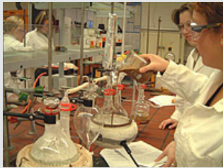
Labor für Organische Chemie an der TU-Clausthal.