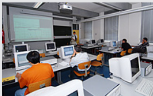
Unterricht an der HAWK.

Der Mangel an qualifizierten Fachkräften insbesondere Ingenieuren ist kein neues, sicherlich aber ein sehr aktuelles Thema, besonders für kleine und mittelständische Unternehmen. Im Februar und März des kommenden Jahres werden die nächsten Absolventen die Hochschulen verlassen und andere ihre Abschlussarbeiten beginnen. Die schwarzen Bretter in den Hochschulen sind voll von ausgeschriebenen Diplomarbeiten und Stellenangeboten.