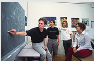
Seminar an der Universität Göttingen.