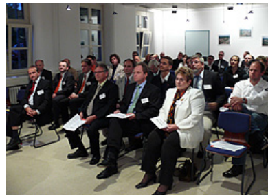
Gut besucht: 4. Forum für Ideen.