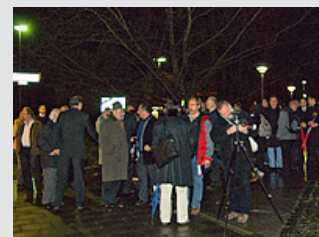
Besucher bei der Einweihung des Kunstwerkes.