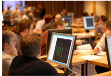
Softwareschmiede ERPA GmbH im Freizeit In – hier traf sich am 9. März 2007 die Elite der Verpackungskonstrukteure aus Deutschland, Österreich und der Schweiz, um neue Funktionen einer 3D CAD-Software zu testen.