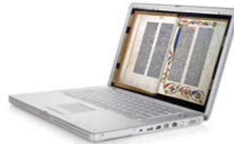
Gutenberg-Bibel online – typisch Südniedersachsen: Modernstes Know-how mit langer Tradition.

Nehmen Sie für ein erstes unverbindliches Gespräch Kontakt mit uns auf.