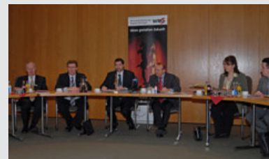
Pressekonferenz am 8. März 2007 zum Start des Innovationspreises 2007.