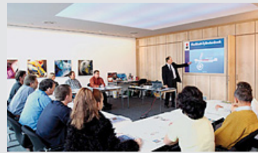
Weiterbildung in Seminaren.

VerpackungsCluster Südniedersachsen e.V.