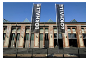
Treffpunkt von Unternehmern im Mai 2010: Lokhalle Göttingen.