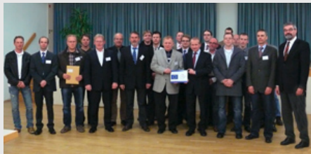
Übergabe der Förderbescheide.

Am 02.12.2009 wurden von Landrat Reinhard Schermann im DGH Krebeck neunzehn Förderbescheide an Unternehmen aus den Bereichen Handwerk, Baugewerbe, unternehmensnahe Dienstleistungen und Industrie übergeben.