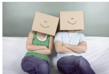
Hat gut Lachen: VerpackungsCluster Südniedersachsen.