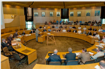
Gründung der Energieagentur am 5. August 2009 – jetzt ist auch die WRG beigetreten.

Mit Wirkung zum Januar 2010 ist die WRG Wirtschaftsförderung Region Göttingen GmbH der Energieagentur Region Göttingen beigetreten.