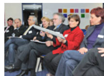
Weckte Publikumsinteresse: die Bürste zum Reinigen für Rinderhufklauen.