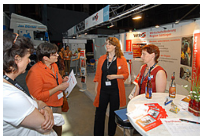
WRG-Stand auf der Entscheidermesse.

„Aus der Region für die Region“ unter diesem Motto präsentierten sich 110 Aussteller auf der Entscheider-Messe ( www.entscheider-messe.de ) vom 8. bis 9. Juni in der Göttinger Lokhalle. Zusammen mit dem Arbeitgeberservice des Landkreises präsentierten sich die WRG und StartPoints den rund 2.500 Teilnehmern an den zwei Messtagen.