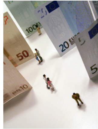
Die WRG hilft bei Fördermitteln.

Der Unternehmerkredit richtet sich sowohl an bestehende Unternehmen als auch an Existenzgründer. Alle Investitionen, die einer langfristigen Mittelbereitstellung bedürfen und einen nachhaltigen wirtschaftlichen Erfolg erwarten lassen, werden über das Programm unterstützt (z.B. Grundstücke und Gebäude, Baumaßnahmen, Kauf von Maschinen und Anlagen etc.). Ab dem 01.07.2007 bietet die KfW beim Unternehmerkredit eine 50%-ige Haftungsfreistellung an, d.h. die Bank oder Sparkasse, die den Kredit an das Unternehmen ausreicht, kann sich das Kreditausfallrisiko in gleicher Höhe mit der KfW teilen. Die Haftungsfreistellung wird allerdings nur für Unternehmen eingeräumt, die bereits seit zwei Jahren am Markt tätig sind (für Existenzgründer existieren bereits ähnliche Programme mit Haftungsfreistellungen). Für die Unternehmen entstehen durch die Beantragung der Haftungsfreistellung keine zusätzlichen Kosten.