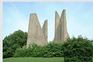
Gebiet mit EU-Förderung: Gemeinde Friedland – hier das markante Heimkehrerdenkmal.

Tel. (05 51) 9 99 54 98-1, christian.heller@wrg-goettingen.de