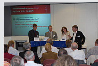
Gut besuchte Veranstaltung. Blick auf das Podium.