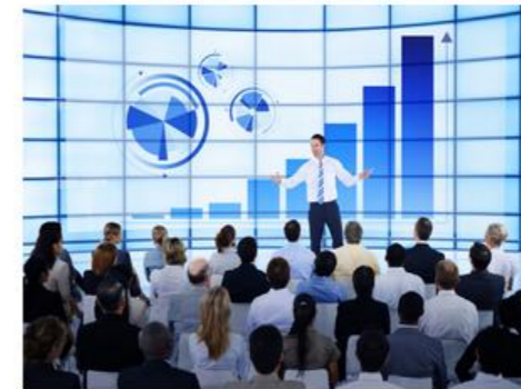
Innovationsakademie & Gründungsunterstützung

Finanzierung des Teilprojekts „Technologieberatung“ durch die EU (EFRE), den Landkreis Northeim, die Wirtschaftsförderung der Stadt und des Landkreises Göttingen (Konsortialführer WRG)