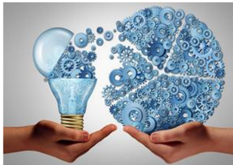
Wissenstransfer & Fachkräftebindung